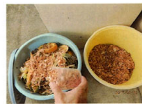
(ポットからバケツへ)

ボランティアクラブ 「グリーンクラブ」の代表者と 副代表者で、グリーンクラブの 活動について説明。 はじめに