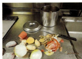
(野菜の生ゴミが出来る)